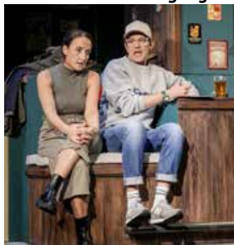
Vor der Paartherapie fließt ab 19 Uhr der Weinbrunnen.

Das Kulturprogramm der Stadt Güglingen startet im Oktober in die neue Saison. Die erste Veranstaltung beginnt am Freitag, 11. Oktober, mit einem Gastspiel der Württembergischen Landesbühne Esslingen „Keiner hat gesagt, dass du ausziehen sollst“ in der Herzogskelter. Seine grandiose Premiere feierte das Stück am vergangenen Wochenende in Esslingen und konnte dabei viel Applaus ernten. Im Theaterstück werden Louise und Tom in eine Eheberatung begleitet und vorher tauschen sich die beiden über andere Paare aus, die von den Therapiestunden kommen. Ein vergnügliches Stück über Ratschläge und Beratungsbedürftigkeit. Zum Kultursaisonstart am 11. Oktober wird der Weinbrunnen vor der Herzogskelter von 19.00 Uhr an fließen. Die Gäste sind eingeladen vor dem Theaterstück ein Gläschen Riesling oder Lemberger zu genießen und mit anderen ins Gespräch zu kommen. Karten gibt es im Vorverkauf oder an der Abendkasse.