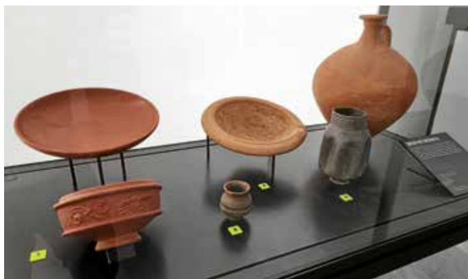
Römisches Keramikensemble, regulär in der Dauerausstellung des Römermuseums zu sehen.

Unter den über 1.500 Exponaten waren nicht nur Alltagsgegenstände, sondern auch herausragende Einzelstücke und Fundensembles von internationalem Rang zu sehen. Der gestalterische Ansatz stellte die Räume und großformatigen Inszenierungen den Ausstellungsobjekten gleichwertig gegenüber.