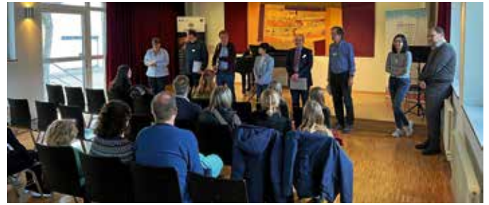
Die Jury bei der Ergebnisbekanntgabe in Lauffen.

fanden die Wertungsspiele dieses Jahr auch in Weinsberg und Lauffen statt.