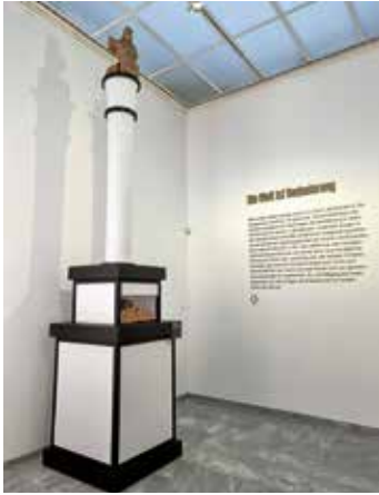
Installation einer Güglinger Jupitergigantensäule als Symbol für die Verschmelzung von keltischen mit römischen Glaubensvorstellungen.

Fundplatz dabei für das Thema „Migration“ und den Übergang von der Römerzeit zu den frühen Alamannen als neuen Siedlern.